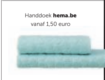
Handdoek hema.be vanaf 1,50 euro