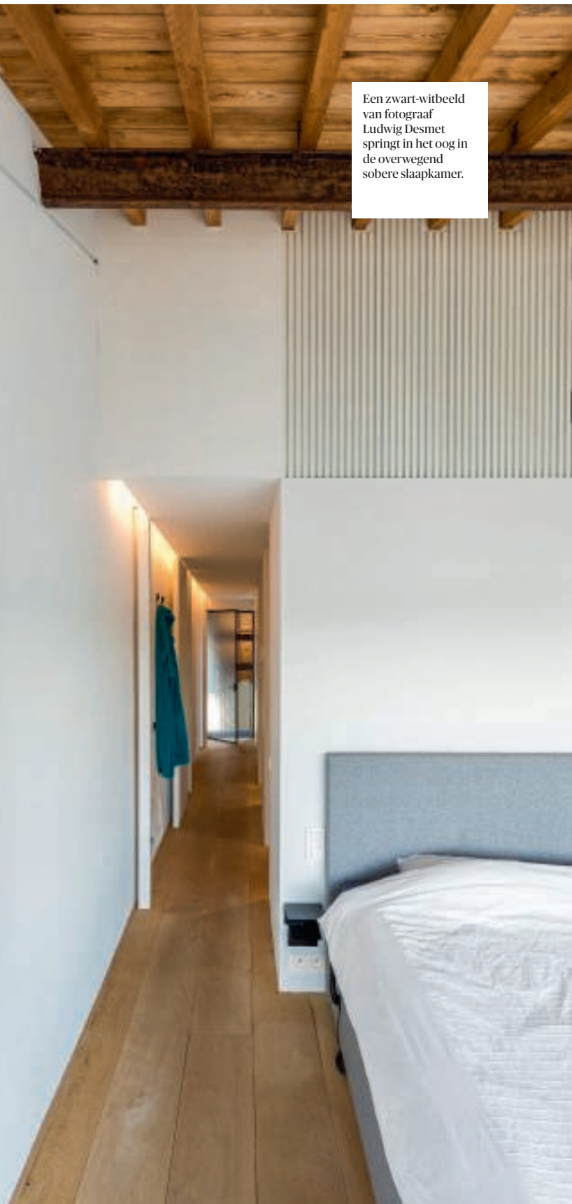
Een zwart-witbeeld van fotograaf Ludwig Desmet springt in het oog in de overwegend sobere slaapkamer.