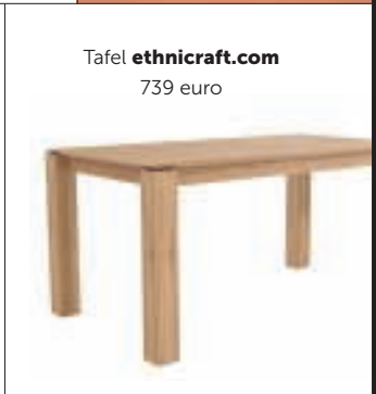
Tafel ethnicraft.com 739 euro