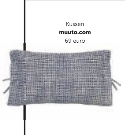
Kussen muuto.com 69 euro