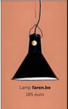
Lamp faren.be 185 euro