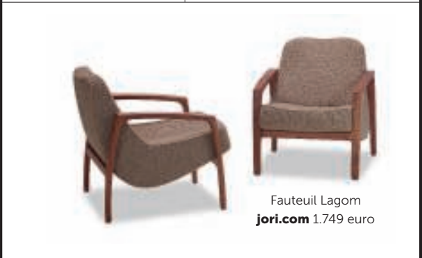
Fauteuil Lagom jori.com 1.749 euro