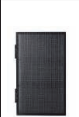
Stalen wandkast met deur in melkglas fermliving.com 339 euro